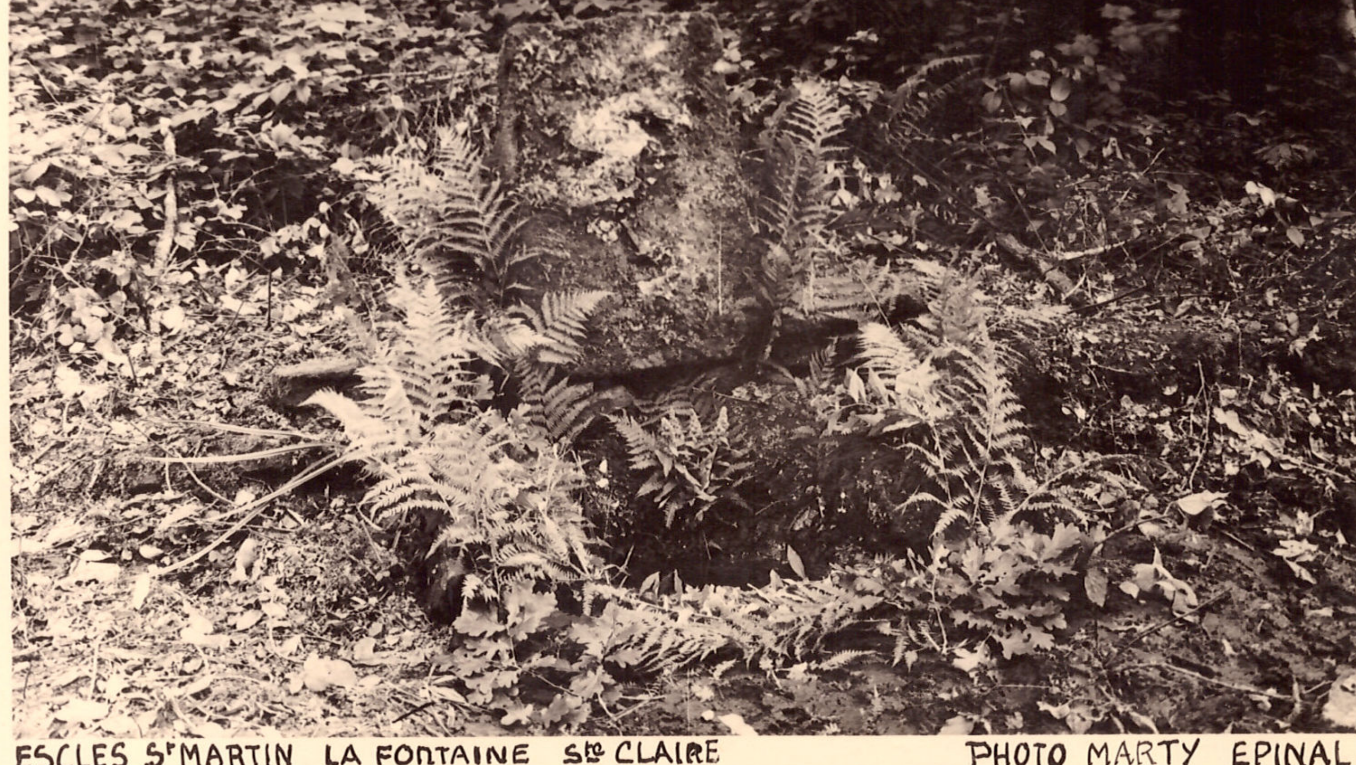
ESCLÈS S t MARTIN LA FONTAINE S te CLAIRE

Près de la chapelle, la fontaine Sainte-Claire offrait encore, au début du siècle dernier, un fronton en grès composé d'une niche entourée de volutes et de deux chandeliers. Il ne subsiste aujourd'hui qu'un petit bassin brisé. Son eau était censée guérir les maladies des yeux.